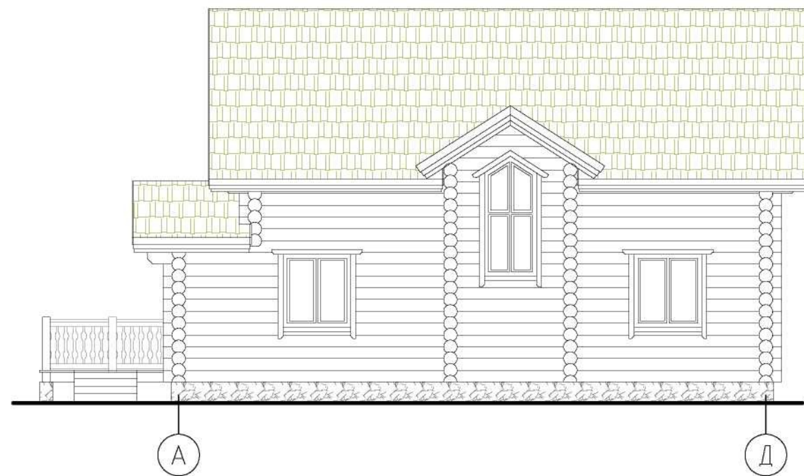
Фасад в осях "А"-"Д"