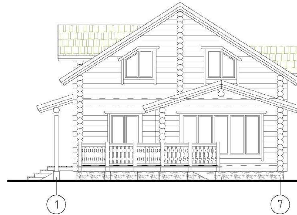
Фасад в осях "1"-"7"