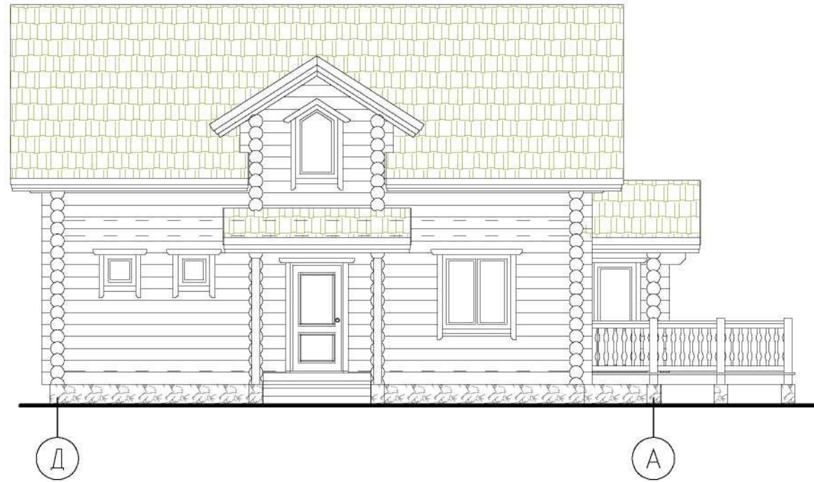
Фасад в осях "Д"-"А"